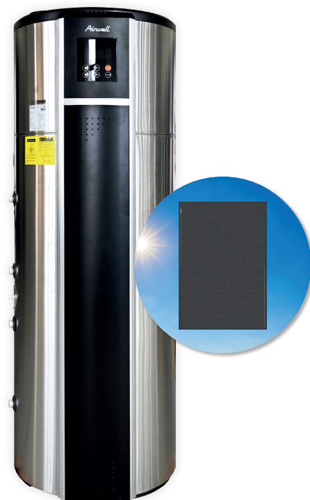
ELEO MS 190L/300L