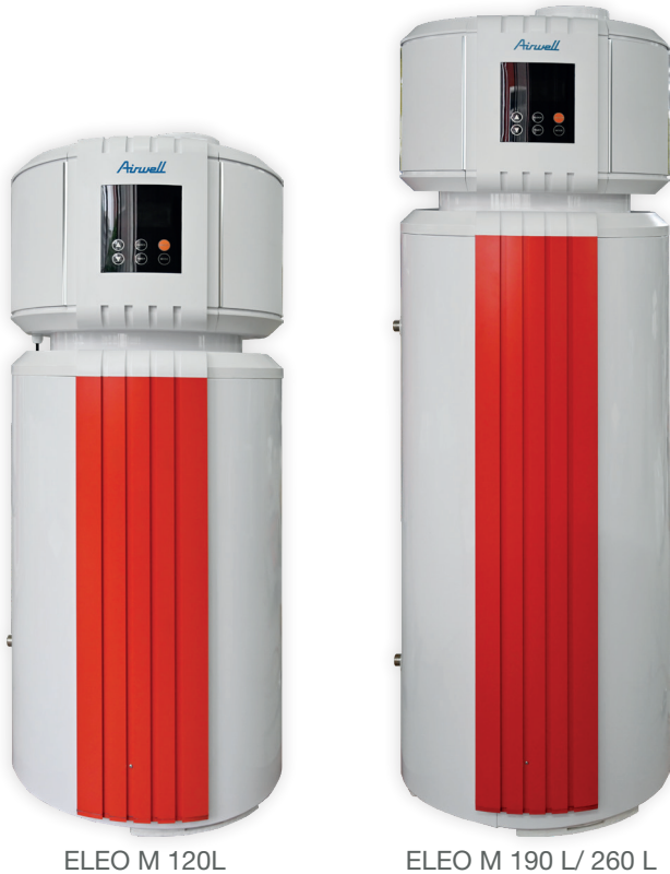
ELEO M 120L