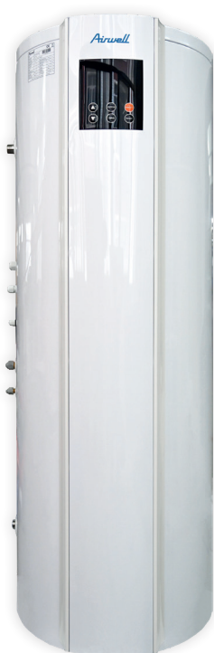
ELEO S 200L / 260L

Ce chauffe-eau prélève l'air extérieur grâce à sa pompe à chaleur séparée du chauffe-eau et installée à l'extérieur de la maison.