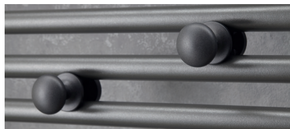
2 patères boutons amovibles