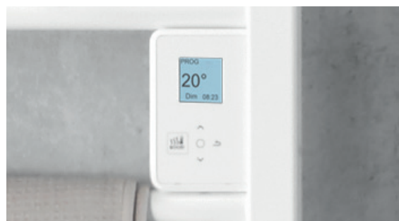
Boîtier digital tactile et programmable