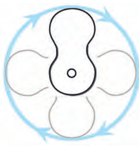
Grille orientable à 360°